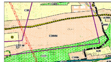
STUDIUM UWARUNKOWAŃ I KIERUNKÓW ZAGOSPODAROWANIA PRZESTRZENNEGO GMINY PSARY skala 1 : 10 000