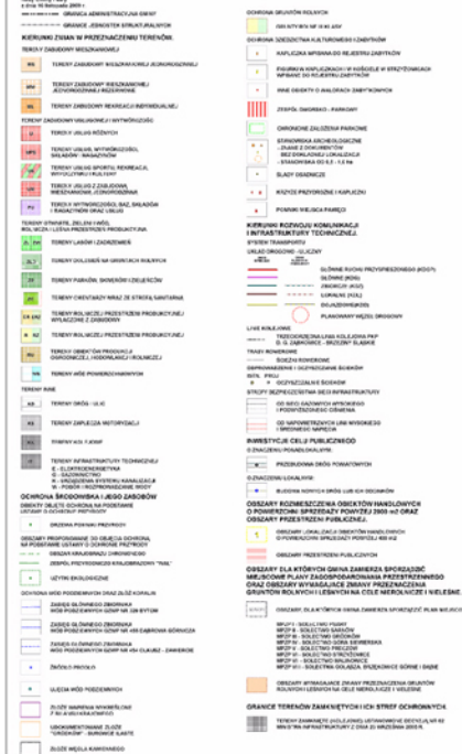
RYSUNEK NR 2 - KIERUNKI ZAGOSPODAROWANIA PRZESTRZENNEGO

Obszary dla których gmina zamierza sporządzić miejscowe plany zagospodarowania przestrzennego oraz obszary wymagające zmiany przeznaczenia grunturolnych i leśnych na cele nierolnicze i leśne